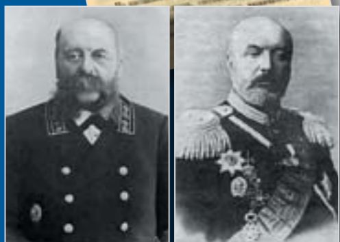
Профессор Н.А. Белелюбский

В обзоре «Цементная промышленность в дни Великой Отечест-